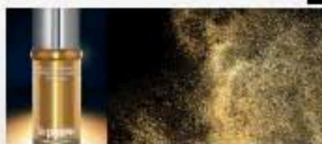
FLUIDE PERFECTEUR OR PUR CELLULAIRE RADIANCE DE LA PRAIRIE : DES PARCELLES D'OR OUI VOTRE VISAGE