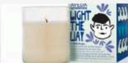
10 ANS QU'AVEDA SOUTIEN LES POPULATIONS A TRAVERS LA BOUGIE LIGHT THE WAY