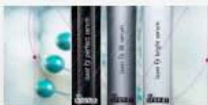
SÉRUM LASER FX BRIGHT DE DR. BRANDT : EST-CE QUE CA FONCTIONNE ?