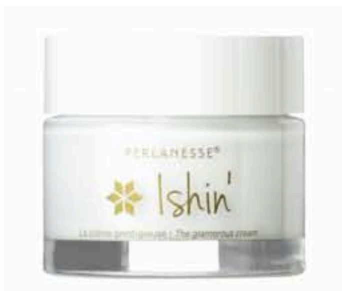
BIMONT – CREME PRESTIGE ISHIN

• Des cellules végétales de narcisse des poètes respectant l'environnement et la biodiversité qui aident à prévenir et à diminuer les taches brunes, diminuent les altérations de la